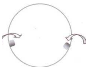
Rys .2 / Fig .2

4. Nieznacznie zgiąć blokady w dolnej części dozownika w taki sposób, żeby kubki trzymały się stabilnie w podajnikach i dały się bezproblemowo dozować, patrz Rys.1 i Rys.2.